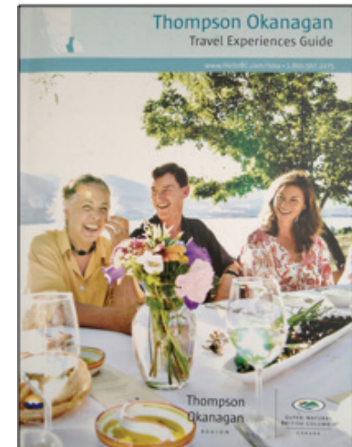
Après le QE : Guide des expériences de voyage