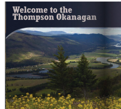
Avant le QE : Guide de vacances