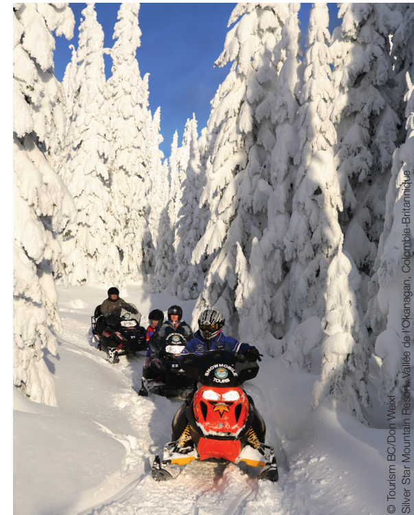
Silver Star Mountain Resort, Vallée de l'Okanagan, Colombie-Britannique

« Le QE est ce qui cimente le tout. Nous avons intégré le QE à notre stratégie régionale, ce qui nous a valu un succès retentissant. Lors d'une retraite, les membres du conseil d'administration de TOTA ont compris toute l'utilité de cette recherche pour notre organisme et les entreprises de la région. Depuis, ils ne cessent de la recommander. Le QE nous a permis de nous rapprocher de Travel Alberta; nous venons d'ailleurs de conclure un protocole d'entente avec Jasper en vue d'initiatives conjointes de marketing ciblant les types de QE que nous avons en commun. »